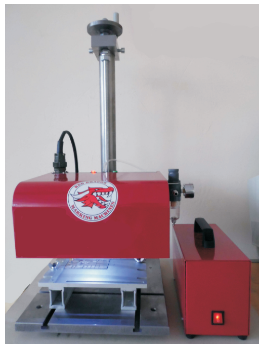
Машина RDB с маркировочным окном 200x150 мм