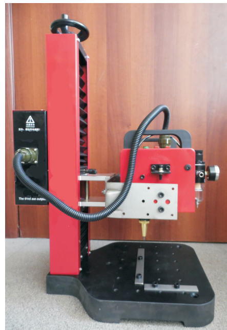
Машина RDB с маркировочным окном 150x60 мм