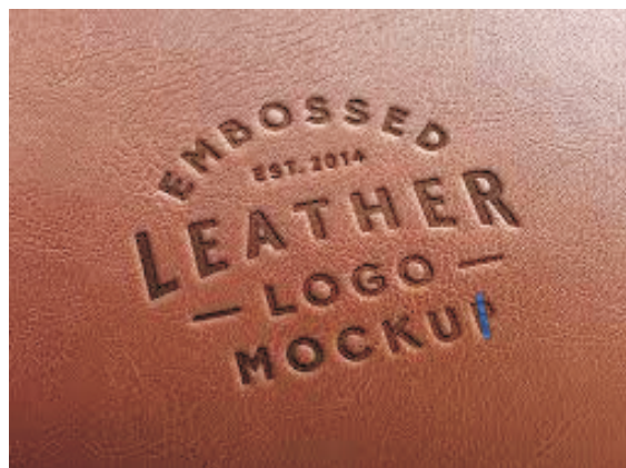
Образец маркировки на коже