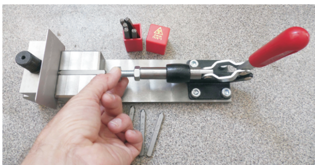
Настройка длины штока